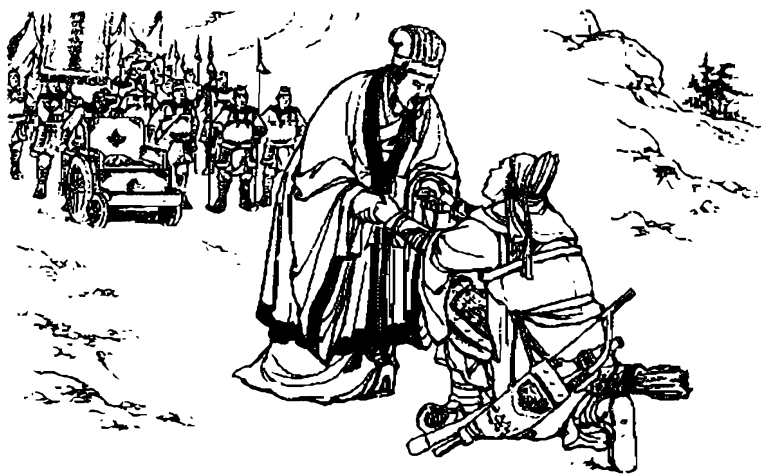
Khổng Minh vội vàng xuống xe đón Khương Duy...

cùng nai nịt lên ngựa, cầm khí giới, dẫn quân bản bộ mở toang cửa thành cho quân Thục kéo ỏ vào, Hạ-hầu Mậu, Mã Tuấn vội vàng dẫn hơn trăm người, lên ra cửa tây, bỏ thành chạy sang rợ Khương.