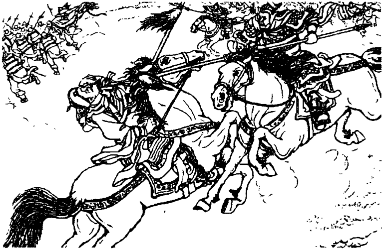
Đạt tháo đường chạy, bị Thân Dam đuổi theo đâm cho một nhát giáo...

trại, rút mũi tên ra, tìm thầy thuốc chữa. Nhưng vết thương nặng quá, chiều hôm ấy chết ở trong quân, bấy giờ 50 tuổi. Tư-mã Ý sai đưa ma về táng ở Lạc-dương.