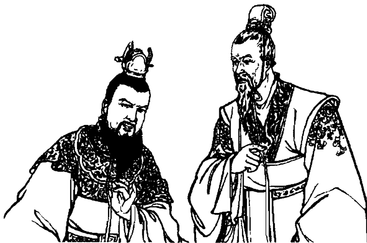
Tôn Quyền - Trương Chiếu