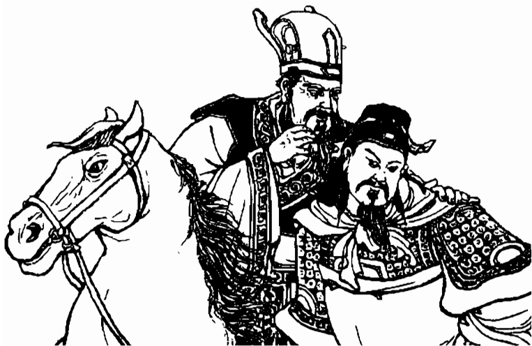
Từ-mã Ý - Từ Hoàng

Hai bên giao chiến được một lát, Ngụy Diên thua chạy. Quan Man sợ có mai phục, không dám đuổi theo.